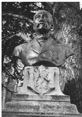
Het borstbeeld van de hand van Jules Lagae.