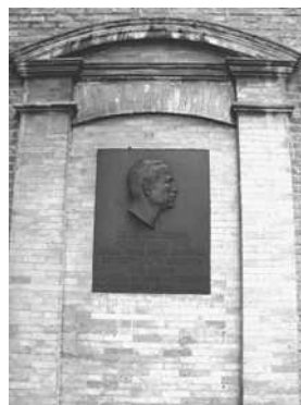
Het gedenkteken op de hoek van de Appelmarkt en de Grote Markt