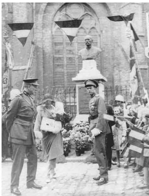
Koning Albert I & koningin Elisabeth